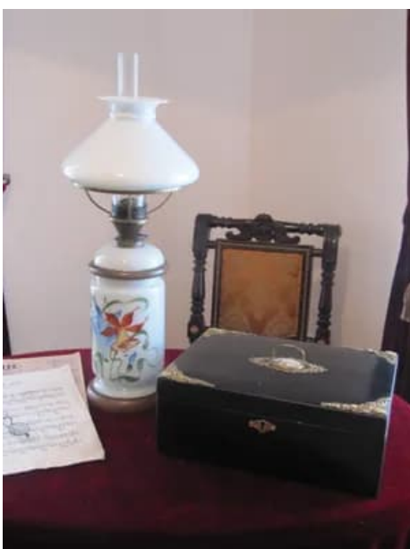
Фото и видео